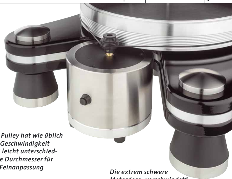
Die extrem schwere Motordose „verschwindet“ zwischen Zarge und Teller

wicht spielen, um die laterale Balance herzustellen.