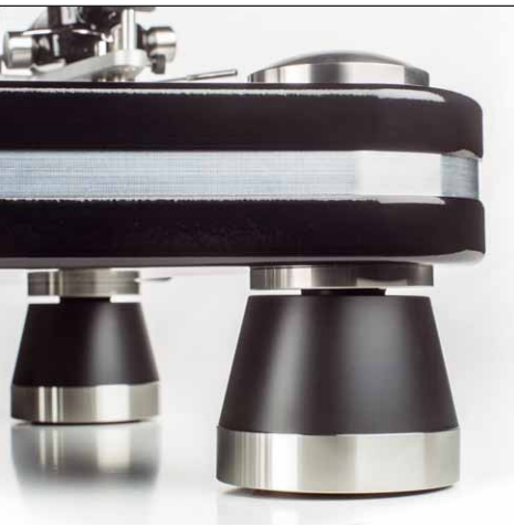
Die neuen VPI-FüÙe noch einmal im Detail