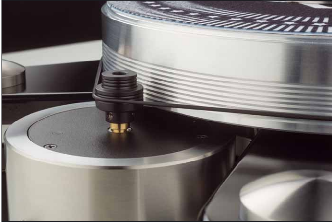
Der Pulley hat wie üblich pro Geschwindigkeit drei leicht unterschiedliche Durchmesser für die Feinanpassung