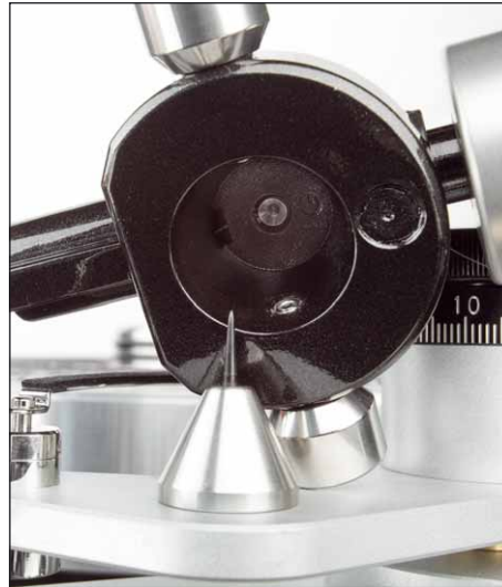
Klassischer Einpunkter mit stehender Lagerspitze

Kerbe schlägt, schon beinahe sensationell. Die Kombination übersieht nichts, zeigt alles, ohne aber komplett ungnädig zu wirken. Fehler beim Spielen oder bei der Produktion werden gezeigt, aber nicht ins Zentrum gestellt. Da steht nämlich die Musik, die grob- wie feindynamisch sehr genau wiedergegeben wird. Eric Andersens Spätwerk „Mingle With the Universe“ wird dadurch über den Status von „Altmännermusik“ klar herausgehoben. Das Album, das auf minderbegabten Abspielgeräten manchmal etwas behäbig klingen kann, ist auf dem VPI entstaubt und offenbart alle Zwischentöne der sauberen Produktion absolut genau.