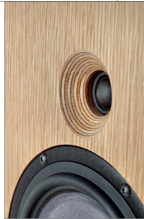
Hier erkennt man sehr schön, wie der Waveguide für den fantastischen Hochtöner in die Multiplex-Frontplatte eingefräst wurde

Zuerst wurde es ein Würfel, ähnlich dem für die Mitarbeiterin, aber größer. Mit etwa 30cm Kantenlänge im geschlossenen Gehäuse und dem gleichen Treiber mit 20cm Durchmesser war das nicht schlecht, aber auch nicht das, was er suchte. Zudem passte der Kubus nicht in das angepeilte Schallplattenregal wegen der hinten überstehenden Kabelanschlüsse. Also ging die Entwicklung weiter. Seas machte ihm jede Menge kleinere Versionen der O/96 und O/93 Woofer mit und ohne Dustcap, mit oder ohne Schwirrkonus, bis er sich schließlich eine Version von knapp 18cm Durchmesser mit Papiermembran, steifer Papierdustcap und Phaseplug wie bei den größeren Modellen entschied. Das war genau, wonach er gesucht hatte. Papier ist übrigens für DeVores Ohren schlicht das beste Membranmaterial für seine Tiefmitteltöner. Es verbindet die gewünschte Steifheit und sehr gute Dämpfungseigenschaften mit geringem Gewicht. Dazu kommt die breite Gummisicke für einen ausgedehnten Bass. Dem Materialübergang vom Papier hin zum Gummi schenkt er dabei besondere Aufmerksamkeit.