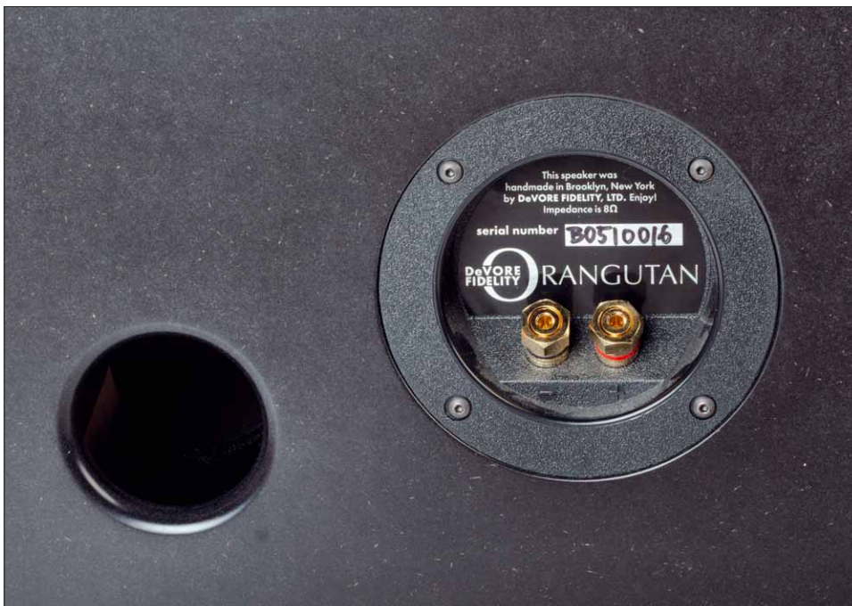
Der relativ kleine Bassreflexaustritt ist natürlich perfekt auf die O/Baby abgestimmt. Viel hilft nicht unbedingt viel