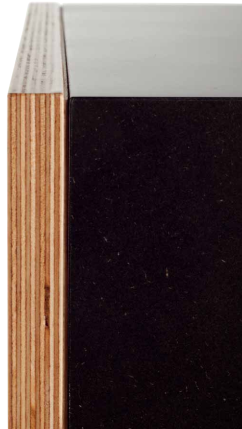
Hier sieht man sehr schön den Materialübergang vom MDF-Korpus zur Multiplex-Schallwand. Look und Klang bilden eine Synergie