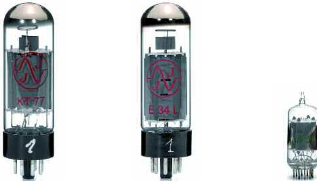
Leistungsröhren-Optionen: entweder KT77 (links) oder E34L, die Longlife-Version der EL34 (Mitte), beide aus dem Hause JJ. Rechts die kleine 5965, eine Doppeltriode, die normalerweise nicht in Audio-Anwendungen zu finden ist

auch zwei schöne lange Kipphebel für die Front. Diese lösen sanfte Klickgeräusche im Innern aus: Relais schalten dann den Amp entweder ein, aus oder stumm, und das Mute-Relais sitzt selbstverständlich nicht im Signalweg. Die schon kunstvoll zu nennende Freiverdrahtung wird