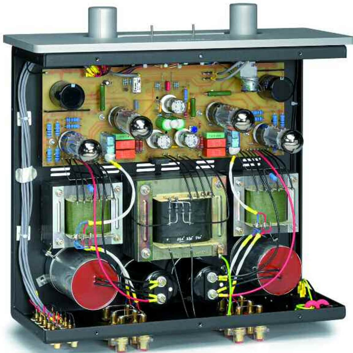
Cherie, lass die 'üllen fallen: verführerischer Mix aus audiophilen und klassischen Zutaten

röhrentypischen Abgriffen für Acht- und Vier-Ohm-Lautsprecher sind doppelt ausgeführt. Das erleichtert das in gewissen Kreisen beliebte Bi-Wiring ungemein, wenngleich ich