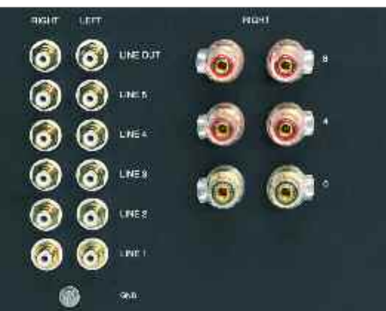
Röhrentypisch: 8- und 4-Ohm-Abgriffe, hier aber in Bi-Wiring-Ausführung

und die restlichen zwei – ja, die auch. Allerdings führen die „Vol. Precise“-Tasten das Motorpoti derart feinfühlig und bedächtig übers Parkett, dass sogar mit hochempfindlichen Lautsprechern perfekte, überaus sanfte Ein- und Ausblendungen gelingen. Ein klares Plädoyer für Geduld und Entschleunigung: Via „Vol. Precise“-Steuerung braucht das Motorpoti für die volle Drehung unglaubliche 95 Sekunden (Lautstärke herunterfahren) oder sogar mehr als zwei Minuten (aufdrehen)! Jeder Sekundenzeiger ist dagegen ein Raser, und würde nicht die rechte LED auf der Front jeden Befehl per Fernbedienung mit einem Blinksignal quittieren, müsste man schon ganz genau hinschauen, um überhaupt irgendeine Drehbewegung zu entdecken. Coole Sache. Wem das zu betulich erscheint, kann das Motorpoti ja mit den „Normal“-Tasten in knapp zwölf Sekunden von Null auf Rechtsanschlag peitschen.