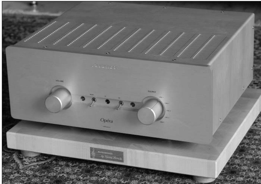
Der Audiomat Röhrenvollverstärker Opera reference liefert 2 x 30 Watt.

eher schlicht und elegant. Die Bedienelemente sind mittig in einer Linie angeordnet und tragen nicht zuletzt zu diesem optisch harmonischen Eindruck bei. Untergebracht sind hier ein Volumenregler, hinter dem sich ein Alps-Poti verbirgt sowie ein Eingangswahlschalter für fünf Signallieferanten. Über einen Kipphebel lässt sich der Verstärker ein- und ausschalten, über einen zweiten die Mutfunktion aktivieren. Ob und was funktioniert, zeigen blaue LEDs an. Die Fernbedienung im Alugehäuse ist obligatorisch und hinterlässt hinsichtlich der Haptik einen ebenso guten Eindruck wie schon der Opera Reference zuvor.