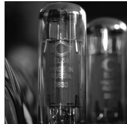
Pro Kanal arbeitet 1 Paar EL 34 aus russischer Fertigung als Leistungslieferant. Als Treiberröhren sind drei 5965 im Einsatz.