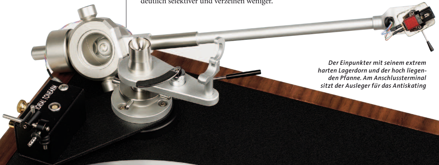
Der Einpunkter mit seinem extrem harten Lagerdorn und der hoch liegenden Pfanne. Am Anschlussterminal sitzt der Ausleger für das Antiskating

Die VPI-bekanntesten Qualitäten Schnelligkeit, Dynamik und Räumlichkeit. Knochentrocken, sauber und kraftvoll wie seine größeren Kollegen marschiert der VPI Classic los – in Verbindung mit dem mühelos und doch substanziell aufspielenden JMW-Tonarm ein echtes Vergnügen. Dazu müsste doch unser gutes altes Benz Ace L passen – gedacht, montiert. Und tatsächlich: Die Kombination rockt vom Allerfeinsten. Tiefste Bassschläge gelingen dem VPI ebenso souverän und ansatzlos wie fette Gitarrenriffs und die präzise Hi-Hat-Abbildung, selbst in donnernden Schlagzeuggewittern. Laufwerkskollegen, die preislich schon ohne Tonarm das Budget für den Classic sprengen, haben hier teilweise deutlich das Nachsehen, musizieren sie doch mit ihren Acrytellern gemächlicher, legen mehr Verbindlichkeit an den Tag. Nun gut, Deep Purple kann der VPI, aber wie sieht es mit Mädchenmusik aus? Frau Melua zeigt uns auf „Piece by Piece“ eindrucksvoll, dass der Classic seinen Namen zu Recht trägt: Mit zartem Schmelz und betörender Zerbrechlichkeit lässt unsere Anlage mit dem VPI an der Spitze auch eine sanfte Frauenstimme in rechtem Licht erscheinen – das Arrangement um die zierliche Sängerin herum kommt dabei nicht zu kurz, werden alle Instrumente dieser cleveren Produktion von Mike Batt sauber und mit viel Luft dazwischen im Raum verteilt – eine beeindruckend dreidimensionale Reproduktion, die genau fokussiert ist.